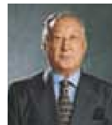
Tunku Tan Sri Dato' Seri Ahmad bin Tunku Yahaya