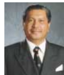
Tan Sri Dato' Seri Ahmad Sarji bin Abdul Hamid

YBhg Tan Sri Abu Talib, 61 tahun, pernah memegang beberapa jawatan dalam bidang Kehakiman dan Perundangan Kerajaan Malaysia. Beliau merupakan Peguam Negara mulai 1980 sehingga persaraan beliau dalam bulan Oktober 1993. YBhg Tan Sri Abu Talib merupakan Pengerusi dan Pengarah berbagai syarikat awam dan swasta. Beliau dilantik sebagai Pengarah Sime Darby Berhad dalam tahun 1998.