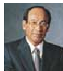
Tan Sri Abu Talib bin Othman