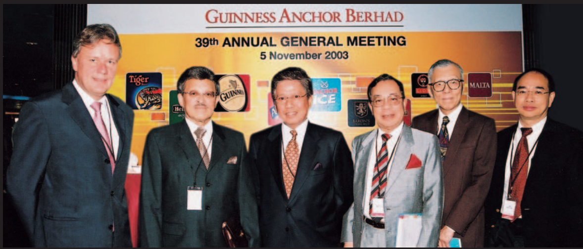
• 健力士英格有限公司董事部全人