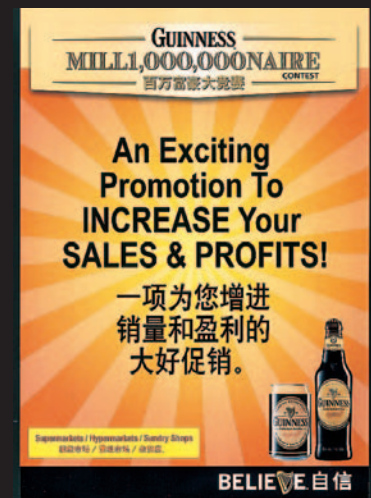
• 主題運動加強了品牌的可見度

今年特殊之處，也在於我們所取得的各項獎賞的數目。其中，虎標在 2004 年度世界啤酒盃，獲頒象徵輝煌成就的歐式皮爾森啤酒組別的金獎。海尼根在亞洲 1000 頂級品牌之中榮居第 35 位，而健力士則囊括了 Diageo Asia Venture 區域九個獎項之中的四個。這些獎賞充份的反映了 我們的杰出品牌組合所具的雄厚實力。