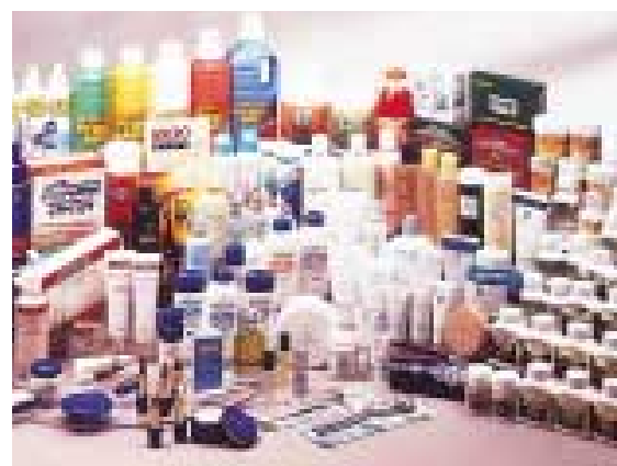
Cosway's range of products.

Strong brand names, a huge distribution network and superior quality products are other key factors to our strength and success. Sports Toto Malaysia, the Group's main earnings contributor, is the largest Number Forecast Operator with more than 600 outlets throughout the country. We are also market leaders in the consumer marketing business. Our strong branding and innovative marketing plans have made Cosway (M) Sdn Bhd a leading direct selling company in Malaysia which has over 400,000 members registered locally and abroad and over 300 stockist centres located throughout the country. The Group is also planning to tap the international market through eCosway, an online business portal which will feature thousands of unique products from all over the world and made available to shoppers worldwide. eCosway is expected to contribute significantly to the Group's future growth. Our vacation timeshare company, Berjaya Vacation Club, boasts outstanding performance where to date, it registered more than 10,000 members and is still growing. The strategic locations of our hotels and resorts and an established brand name has enabled us to achieve a more significant market presence and market penetration in Malaysia as well as internationally.