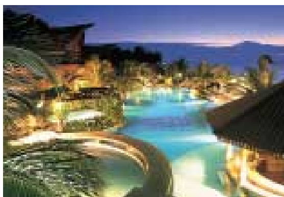
Berjaya Tioman Beach Resort, Malaysia.

With a wide range of network, efficient workforce, top quality products and successful and well-managed businesses together with our focused approach, the prospects for the Group remain good. The Group's involvement in internet related businesses would enable the Group and its subsidiaries to tap on the vast potential of the new economy, driven by advanced information technology to significantly enhance the Group's various business processes.