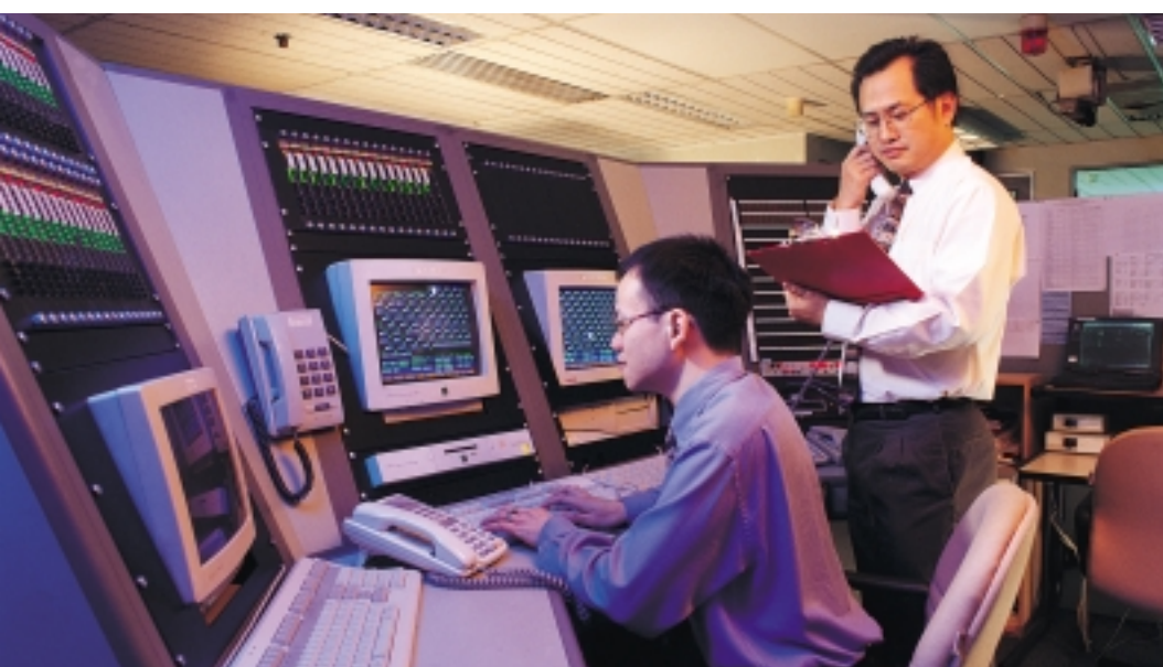
Communication Control Console, which controls the entire data communication network.

区域货币危机使我国经济在去年经历了史无前例的改变和挑战。去年第三季货币大贬值造成银根紧缩