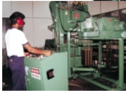
Machinery financed by Prime Credit Leasing.