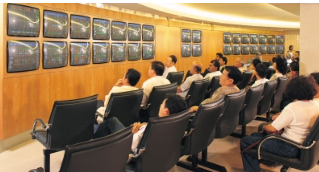
Inter-Pacific Securities' viewing gallery.

由于保留率从56.1%提高到57.3%，保费净额的减幅降到9.1%，即从1亿3百60万零吉减少到9千4百20万零吉。尽管营业额减少，该公司仍取得1千零40万零吉盈利，比前年的7百80万零吉增加了33%。这是由于公司继续对接受投保和管理开销的控制，采取明智的方针，以致索赔比例改善之故。连同投资和其他收入1千5百70万零吉，以及扣除7百10万零吉预拨投资价位贬损储备金之后，该公司取得1千9百万零吉的税前营运盈利，去年该公司却蒙受3千6百70万零吉营运亏损。