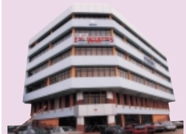
Eng Securities' office building in Johor Bahru.

在检讨年里，该公司的保费总额减少2千零40万零吉，从1亿8千4百80万零吉减少到1亿6千4百40万零吉，即降低了11.04%，这主要是因为经济衰退的原故。不过，