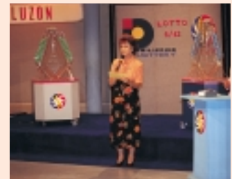
A Draw being conducted in the Philippines.

Buat masa ini, lebih 100 terminal berasaskan PC luar talian telah dipasang di Accra, ibu negara Ghana dan bandar-bandar berhampiran.