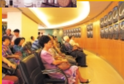
Viewing gallery at Inter-Pacific Securities.