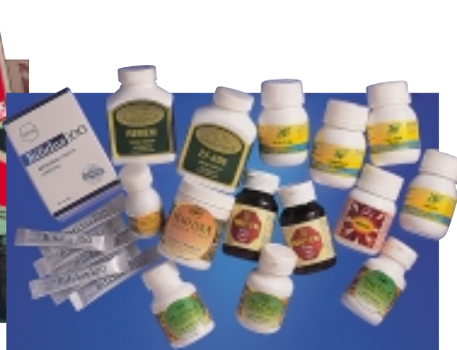
Health supplements from Cosway.