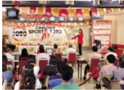
A Toto draw being conducted in full view of the public in Malaysia.

tax and pool betting duty which came into force on 1 November 1998.