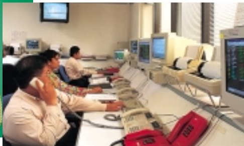
Trading area at Inter-Pacific Securities.