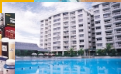
Sri Petaling Condominiums, Kuala Lumpur.