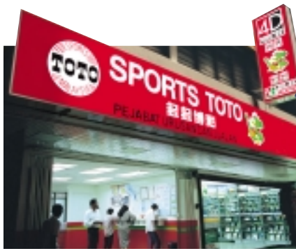
A Sports Toto outlet.