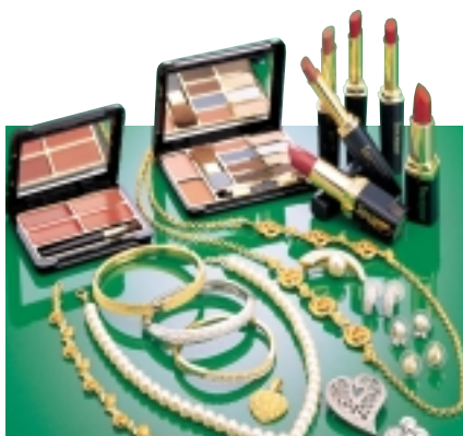
Cosway's range of cosmetics and costume jewellery.