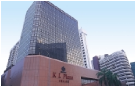
KL Plaza, Kuala Lumpur.