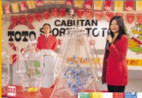
A Toto draw in progress.