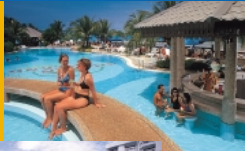
Pool-bar at the Berjaya Tioman Beach Resort, Malaysia.