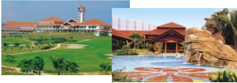
Bukit Jalil Golf & Country Resort, Kuala Lumpur.