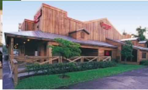
A Roadhouse Grill restaurant in USA.