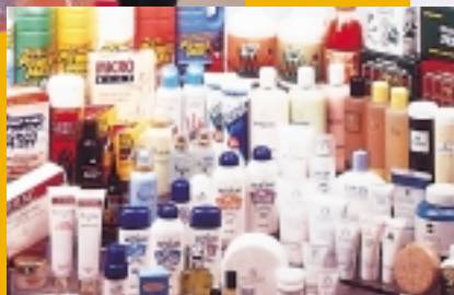
Cosway's range of products.