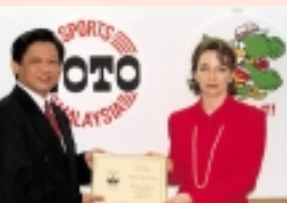
Berjaya Sports Toto was voted one of the ten best-managed companies in Malaysia for 1998/99 by Asiamoney magazine.