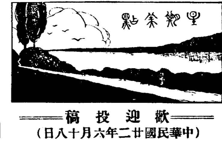
稿投迎歡 (日八十月六年廿國民華中)