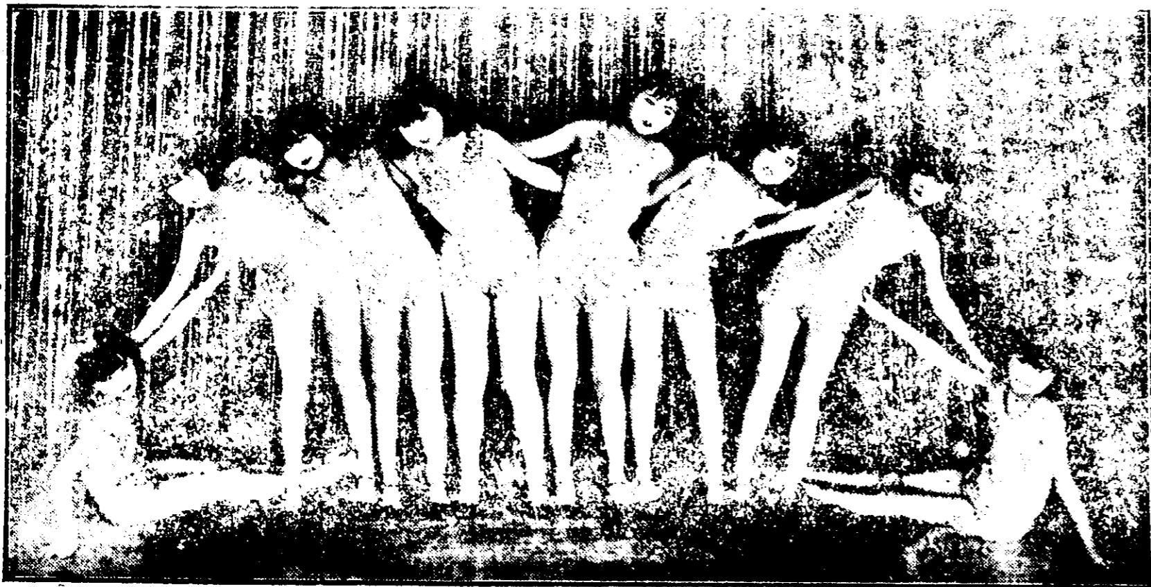
[果之愛] 之 演 表 團 舞 歌 花 梅 海 上