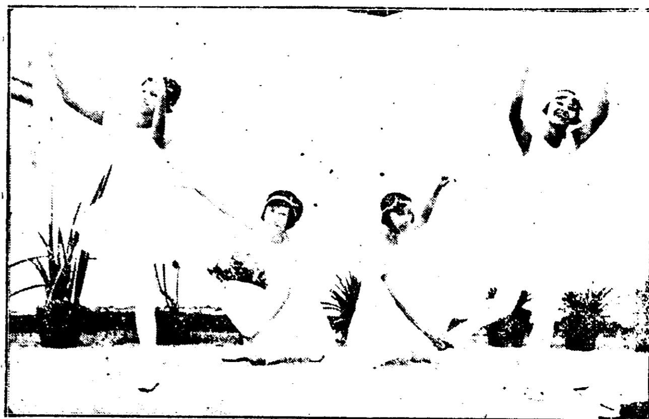
星明小之演表欺籌藝游園稚幼洲星