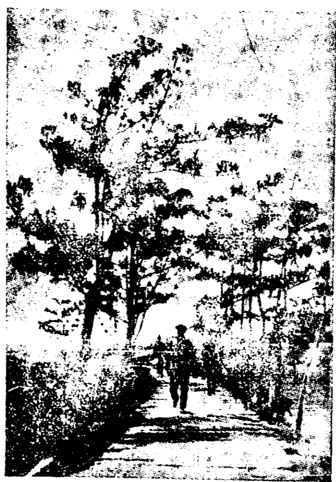
廣東五眼橋之風景