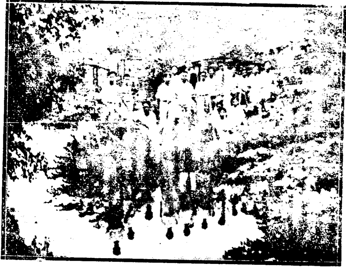
影攝行旅生員校學正養坡架星