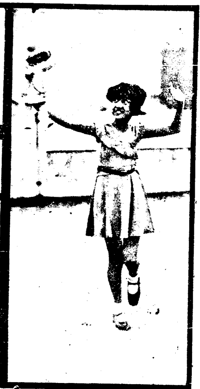
明說 (右)子鬼小(右一)士女裕家陳(右二)娃娃洋的我(右三)下如版製影攝者演表備預其將愛,會藝游開界世大座假,晚兩三十二月五於定,園稚幼洲星坡架星 (左)狼老一(左下)侶情與利威(右)友朋小(左)Way up on the mountain top歌情表文英