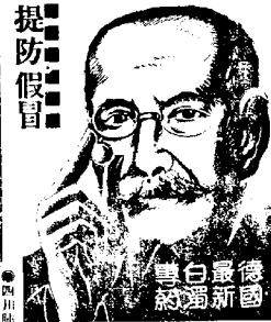
德國青年良友... 提防假冒