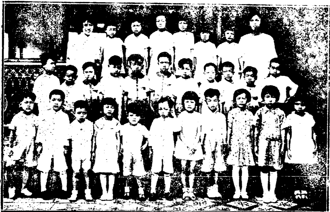
後 組 改 校 女 福 崇 館 會 建 福 坡 架 星 影 攝 體 全 念 紀 週 一 辦 創 園 稚 幼