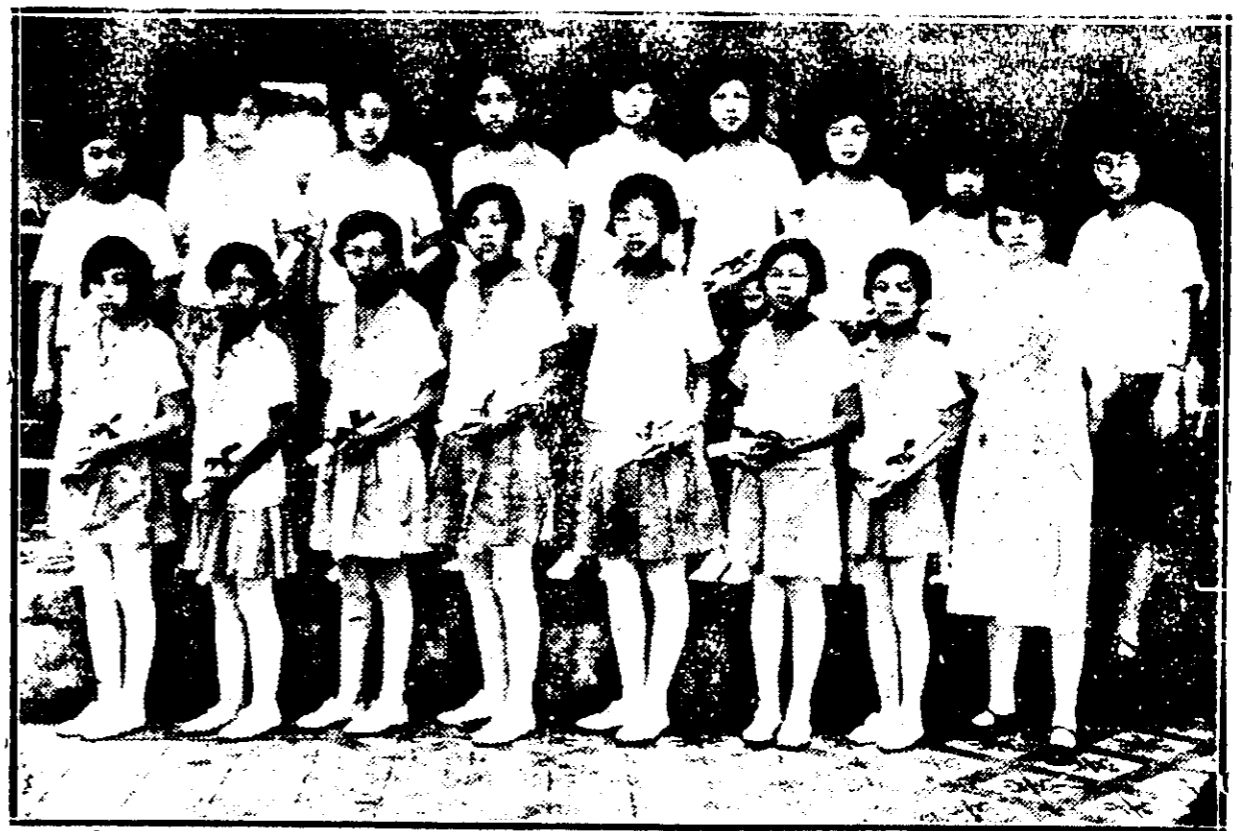
後 組 改 學 女 福 崇 館 會 建 福 坡 架 星 影 攝 生 業 畢 學 小 期 後 前 屆 四 第