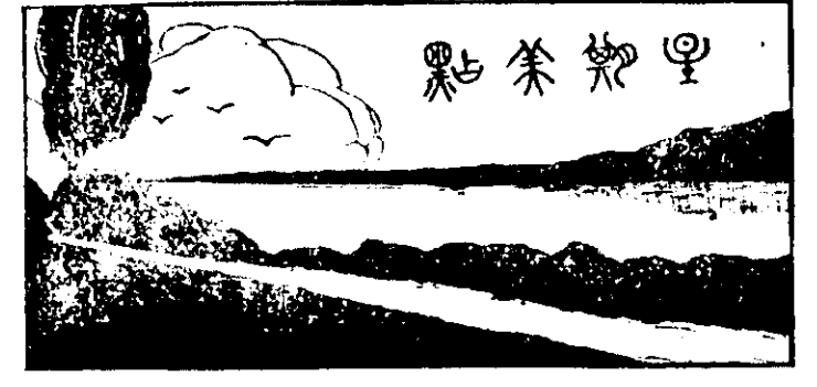
稿投迎歡 (日六十月十年一廿國民華中)