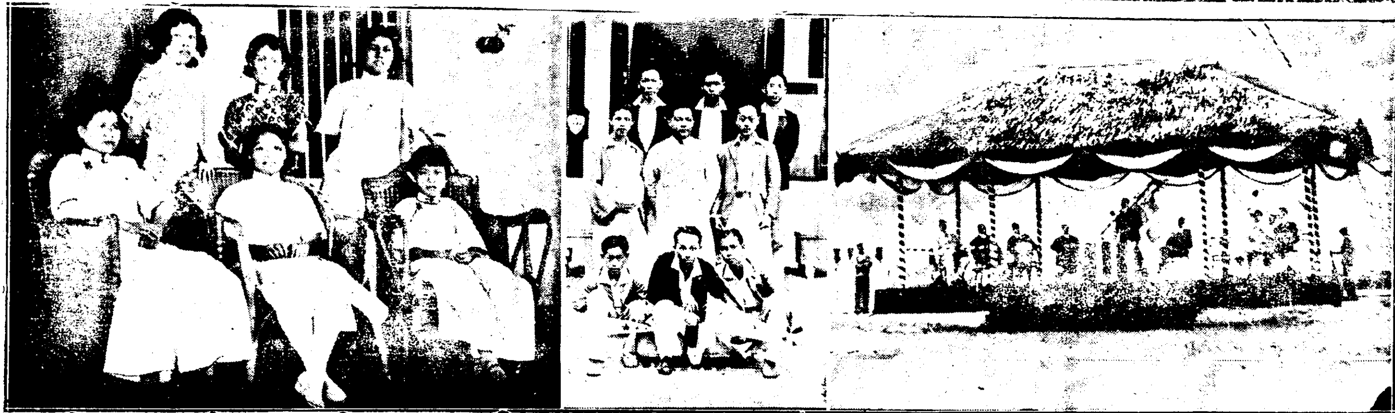
「說明」上圖：(一)星加坡直落亞逸埠舉行落成禮。雪蘭莪我精武兵隊遠征隊。(二)星加坡檳榔嶼吉隆坡精武女會合影。下圖：星加坡直落亞逸埠落成禮。