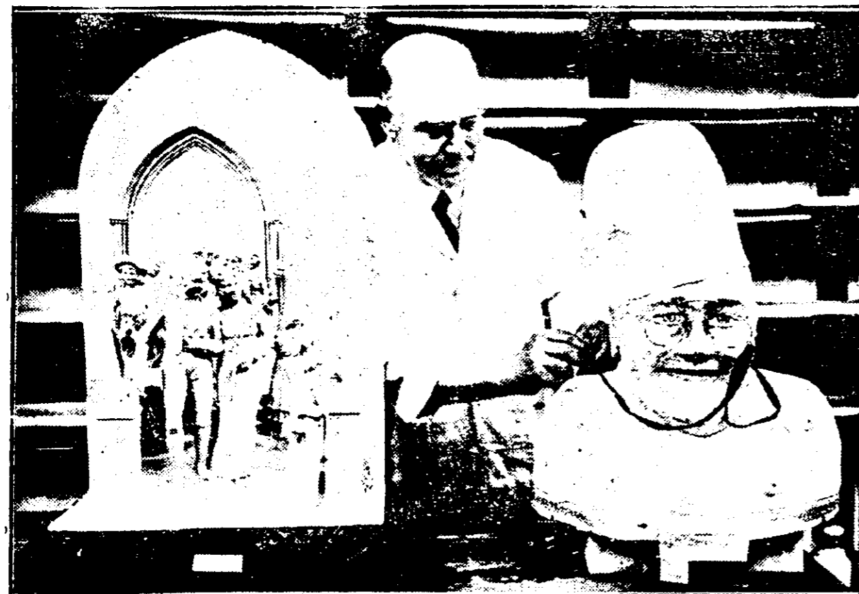
雲成製糖用是均，頭的長首爲一，式婚結爲一，品覽展的美精個兩中會爲圖，關熱之常異者加參