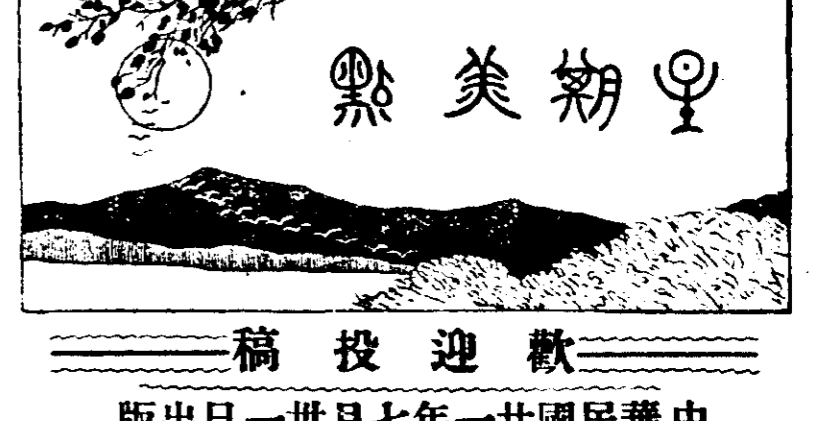
美點 稿投迎歡 版出一廿月七年一廿國民華中