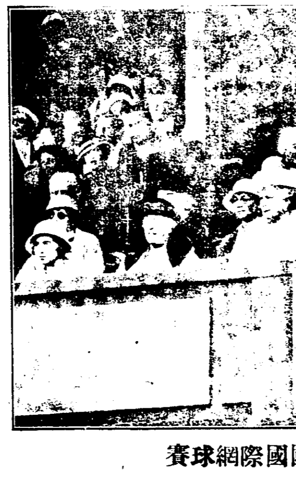
賽球網際國國英觀參后借皇英