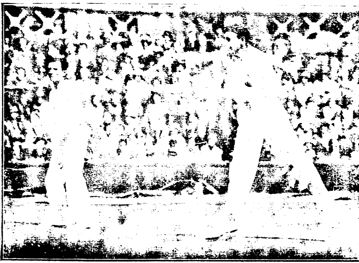
軍冠國法打賽球網際國國英

上海當局。發出通令警告各輪船公司。謂最近接到一種確實報告。大鵬灣之海盜。已經出發。集中於