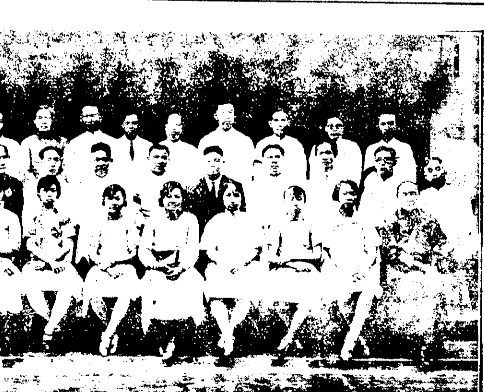
影合員職會員委賑籌所公僑華佛柔 (贈吉合陳)