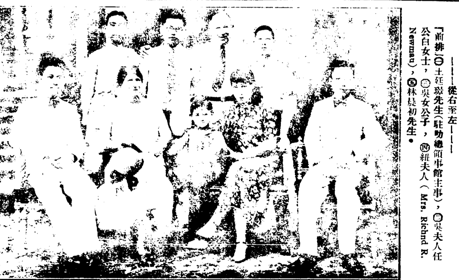
影攝時叻過生先聲凱吳表代會聯國兼使公士瑞駐國我

一週間之樹膠市況 過去一週間，樹膠市況，仍極沉寂。新加坡樹膠，計乘客車輪將增價百分之十。此項增價，係因橡膠原料價格上漲所致。此外，樹膠市場之交易，亦趨於清淡。