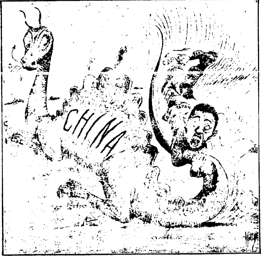
這是紐約時報二月二十八日的時事漫畫。標題爲拉住他的尾巴。那條龍是象徵。國。拉住龍尾巴而驚惶失措的人。就是日本。他有意思。就是說這個小小的日本。那龍能夠制壓強大的中國。

英皇儲威爾斯。在倫敦招徠經理人協會中演說。討論店員術。彼力主往世界各地與尋覓英貨新顧客之要着。彼謂現在全世界所急需者。乃爲擴張國際之貿易。而非加以限制也。彼主張須