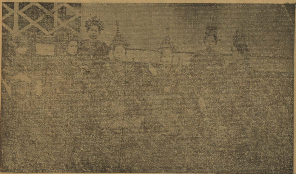
(坤 洛 曰 名) 劇 戲 式 舊 羅 暹