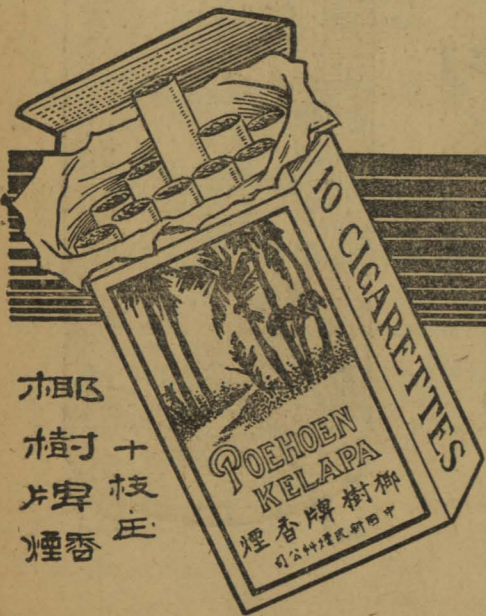
椰樹牌香煙 十枝庄