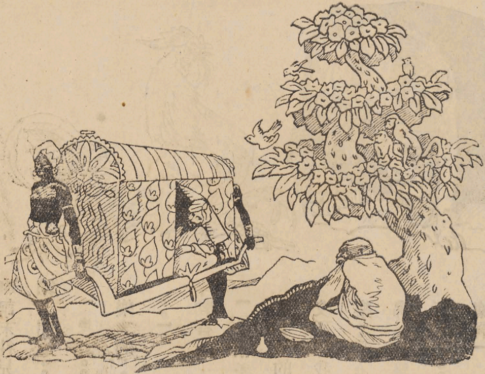
○ 加敢僧教回於治求 ○ 病了得長酋末訶摩