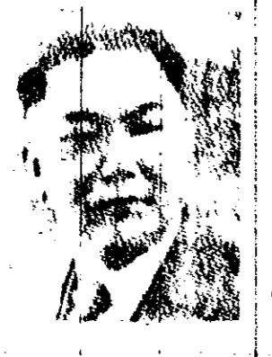
旅馬來亞全體同志 並勉僑努力投英