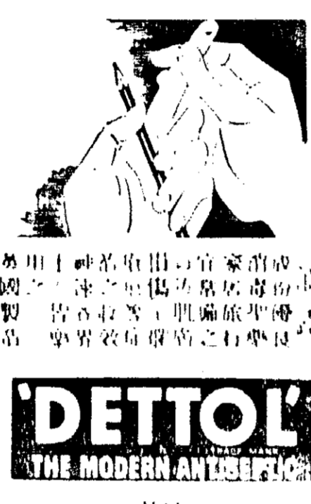
DETTOL THE MODERN ANTISEPTIC