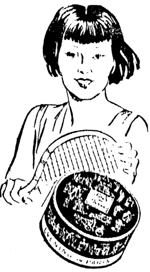
蔣夫人致詞勉共努力

中央駐滬電。蔣夫人。於昨日在滬各界。舉行週年紀念大會。致詞勉共努力。謂：我國目前。正處於艱苦之時期。我全體國民。應一致努力。共赴國難。以期早日完成建國之大業。