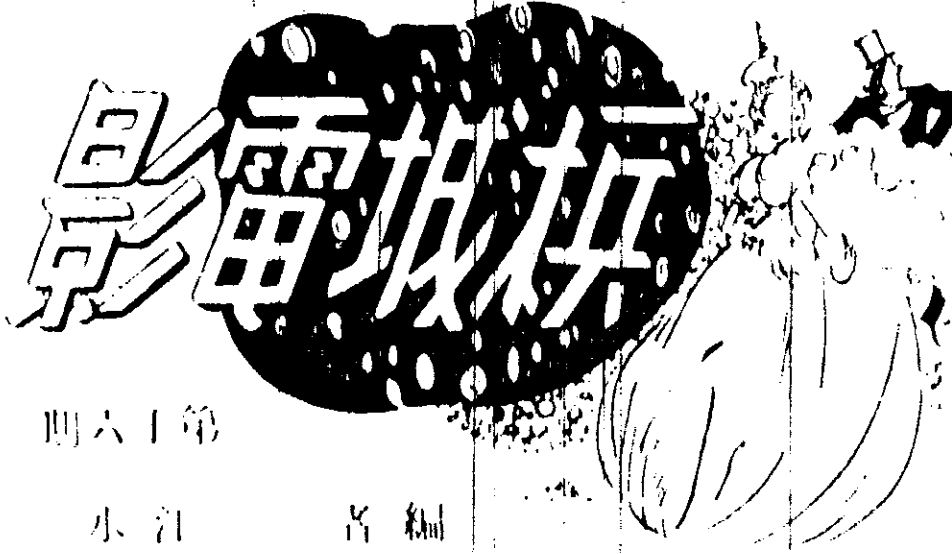
香箋淚 劇本：宗君 導演：宗君

「香箋淚」的導演，現在說到本片時，大有「一鳴驚人」之勢。... （一）介紹本片各工作人員 （二）本片之優點 （三）本片之缺點 （四）本片之地位 （五）本片之評價