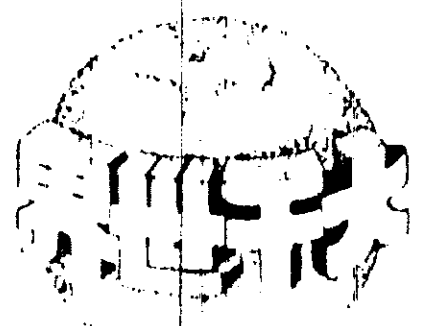
英國人的戀愛生活