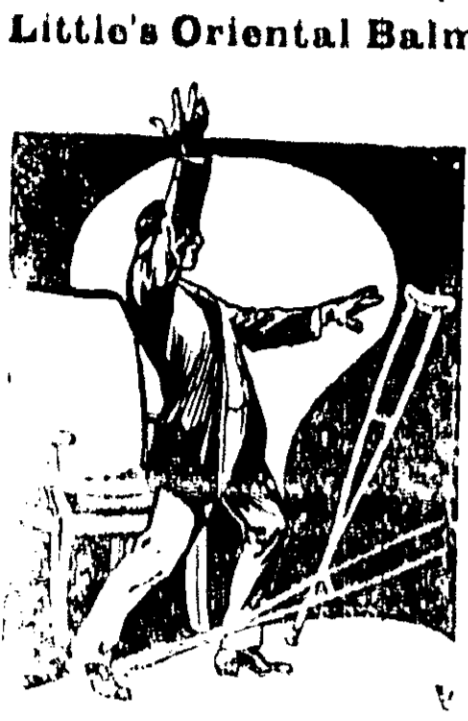
Little's Oriental Balm