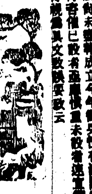
法前未編成立今年...