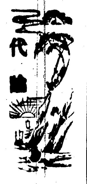
水塔高設車廠廣印字則另置一館貯煤則