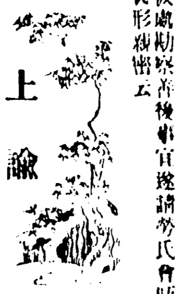
Caption for the illustration.