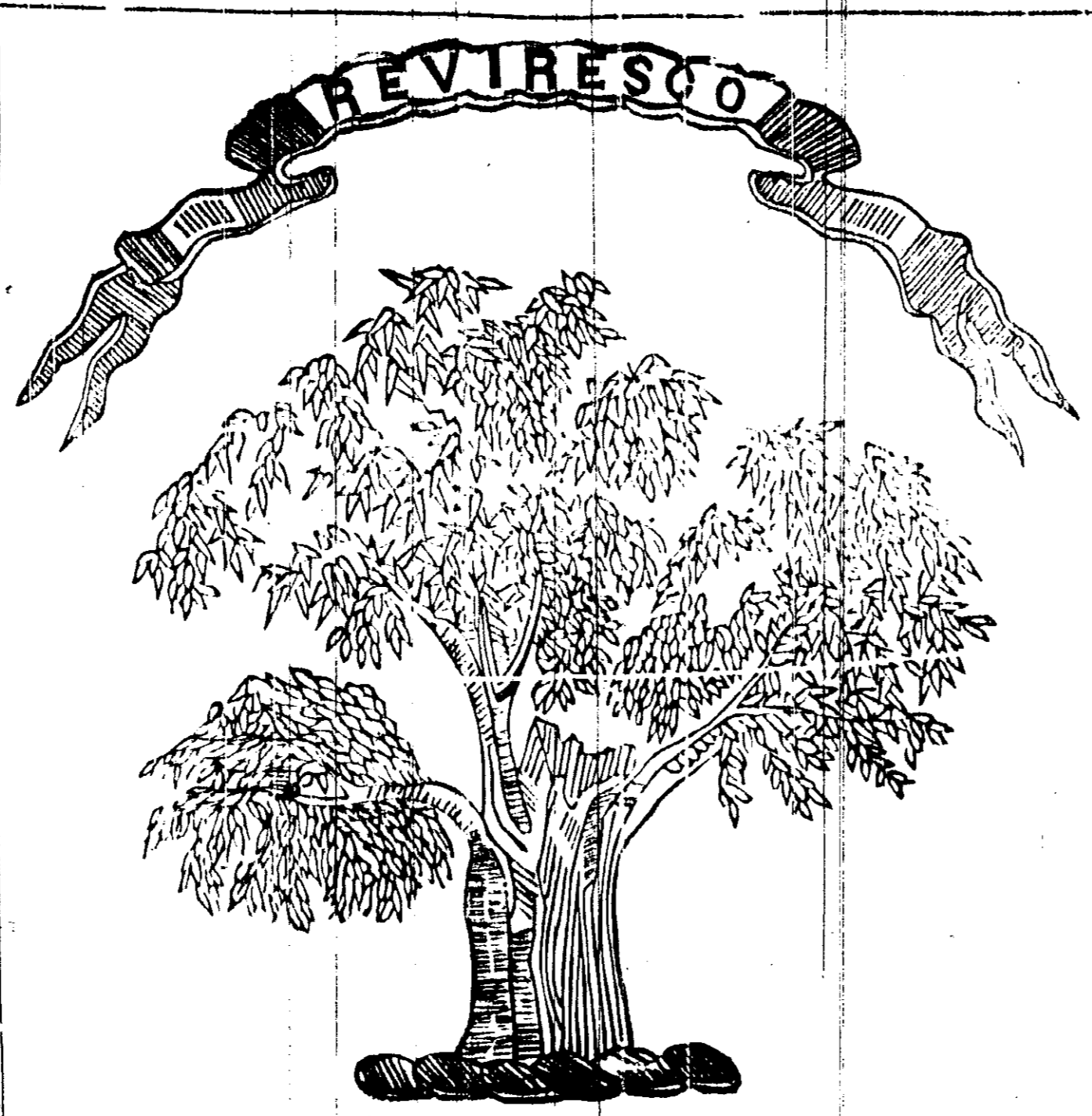
SHAG BIRD'S EYE TOBACCO.