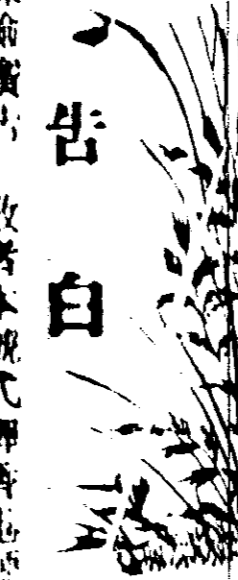
Advertisement for a specific product or service.