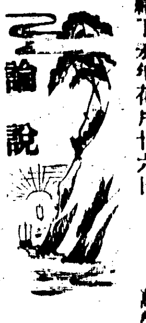
雲南危殆之可憐 下下稿