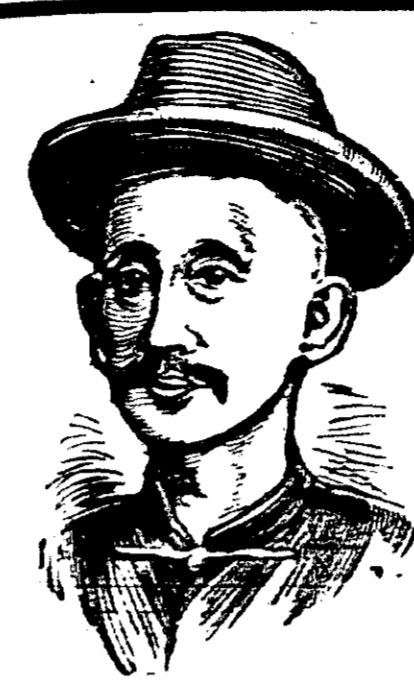
光緒三十二年三月二十日

石叻大馬路六十五號對人云弟向有風濕骨痛之病痛楚不堪呻吟床第至今思之尚覺毛骨悚然... 楚全無并可重理舊業矣先是兩年前少翁偶染風