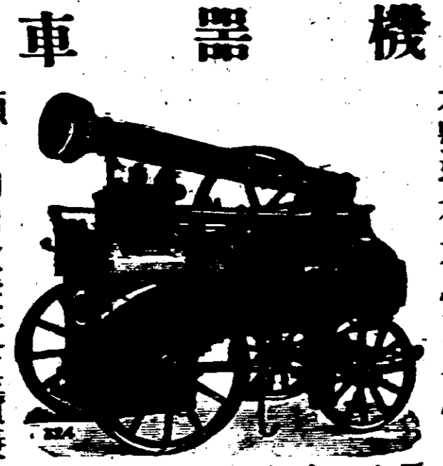
本號現有六馬力八馬力十馬力及十二馬力機器車常便待沽并能定價由四馬力至十四馬力常便經家商家購用稱係上等堅固之貨所用煤炭其省能運移免勞力 諸君光顧請向敝號貨真價廉

19, BEACH STREET, PENANG. GENERAL GOODS FOR SALE