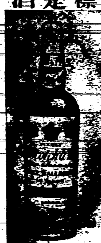
五王帽標項士委實杞酒