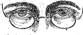
Are clean, cool, & preserving to the Sight.

上好歐洲眼鏡出售 LAWRENCE & MAYO'S PERFECT PEBBLES