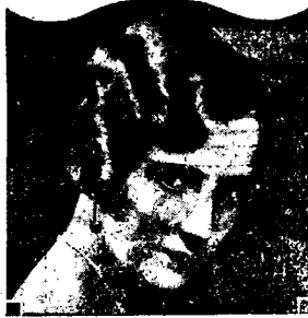
將使君之頭髮雙倍美麗

EASTERN UNITED ASSURANCE CORPORATION, LIMITED. 司公限有險保東聯