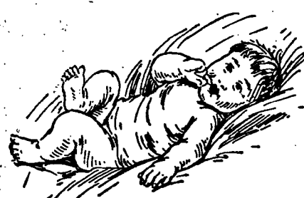
望希新與母之孩嬰

年兩 家學科前 明發理光日從 年去而 業機生一 素機生此病毒「素頁吉」 「素頁吉」名如以所入加 字標此見得之標每於可 能素頁吉光日補此安樣 前直骨壯 兒兒小使 驗其弱化賦美 珍一唯之 良品