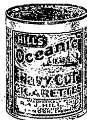
頂上一號奧地亞之尼威威烟每罐五十枝...