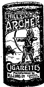
此種亞地亞之烟每包二十枝...

OBTAINABLE FROM ALL DEALERS. H. WOLSKEL & Co. SOLE AGENTS