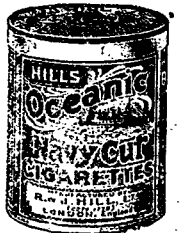
頂上一號奧底亞之尼威威威威威威威...