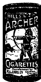
此種亞德標之烟枝每包二十枝

OBTAINABLE FROM ALL DEALERS. H. WOLSKEL & Co. SOLE AGENTS