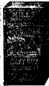
此標乃是特別奧底亞之尼威威威威威威威...