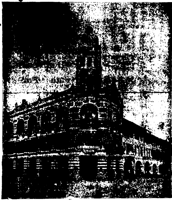
新嘉坡羅敏申律咁嗎施有連保險有限公司之圖