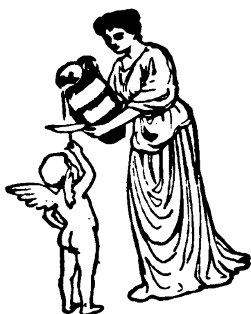
謹臣大醫 生之高劑 科士非湯 匯水出世

此高劑科士非湯匯水乃謹臣大醫生始創製成飲之能補腦榮筋壯血養顏有益衛生誠飲食中之第一要品也經各名醫用過均皆讚美與各埠青年會及中西士商均亦稱羨如常飲此水必令筋骨強壯精神和暢孩童飲此水能壯筋骨而且此水能減水中之蠱使飲者免病本坡代理人乃星架坡藥房坐落禮佛不釐士門牌四十號 每逢拜一下午或拜四上午 諸君請到本坡禮佛不里星嘉坡藥房試飲此水一杯不收費用而該藥房有在各酒店及各公館以此水和梳打水供人吸飲并此佈 聞 英一千九百零七年十一月廿三號