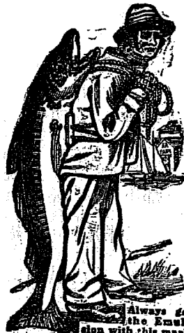
Always get the Emulsion with this mark - the Fishman - the mark of the "Scott" process!

司各脫係用最純潔之鱉魚肝油該油含有各種滋補性質并配和他種出名藥料精心泡製專醫一切喉症肺症胸膈等症血經諸病氣喘血虧氣管發熱癆瘵咳嗽受寒等猶能補足元氣轉弱為強再司各脫滋補藥酪其味絕佳緣又攪和貴重馨香藥料所以其白如乳其濃似酪故味甘適口殊令人覺之頗堪下咽也