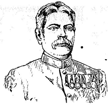
係 耶巴利刺非參 曾蒙 賞佩 暹廷白象各等寶星云云

行兇釀命 ○潮人鄭學裕居于甘公麻六甲門牌六十四號十四日胸左受傷乘車前至捕房轉送醫院據稱伊有全籍全姓名加弟常到伊家自言欲充暗差是以借洋銀十元藉供費用伊已屢次却之迨至是日又復來家求貸不遂轉身外出逾刻復回是時伊適小立騎樓下猝被加弟揮刀刺傷胸左伊急鳴差四無差至致被加弟逃去云云醫生為之調治厥後傷處屢愈鄭故求遣回家自行將養因料念四夜八點鐘卒于家內屍親報捕以候緝兇究辦云 康健有由 ○英人些利輔現在服官選國蓋楚材而皆用者也公忠體國勤勞素著是以帝心簡在崇銜疊加年雖老而精神矍鑠器宇軒昂推其愈老愈壯之由乃因常服韋廉士大醫生紅色補丸所致云日昨有客往暹得登些君之堂而聆其語者歸而為予述之曰 些君云韋廉士大醫生紅色補丸之神妙有令人不能一日忘之者憶曩年壯閉為患過身困憊或則頭昏眼花舌起黃胎四肢疼痛腕上足筋抽促屈伸不能自主須起而步行其痛方止所延各醫俱皆以瀉為主雖身如藥府而寸効毫無後閱某報紙所載韋廉士大醫生紅色補丸功用圖說付思賤恙之原未始不因血虛有毒所致此丸既云有清血活血養血之能料必對症遂向暹京必列的士藥房購得此丸九多少歸而服之乃甫服即見功效大便調勻而筋力亦漸長是以連服無間以底於全愈計近日精神而論比往年尤強也此些君之言也夫以些君之恙羣醫束手而竟以區區紅丸立起沉痾者其故何哉此無他此丸有活血養血之功清血補血之能而已血足則百病無自而生故此丸能治一切 肝病 腎虧 積滯 反胃嘔吐 左癱右瘓 腳氣衝心 筋枯氣弱 未老先衰 遠年風濕 瘡疥癩疹 婦女經來各病與夫一切發熱病後 下痢病後傷風咳嗽病後等症各處藥店均有發售或直向石叻海邊第一度吊橋脚 韋廉士大醫生藥局探買亦可 每一罇價銀一元五角 每六罇價銀八大元 不論遠近一律不取郵費 再者些利輔君之銜係 耶巴利刺非參 曾蒙 賞佩 暹廷白象各等寶星云云